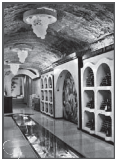
„Monopolowy” w Mileştii Mici

Wizytę w podziemiach dobrze zamówić wcześniej. I dobrze mieć samochód. Na szczęście udaje mi się wcisnąć do auta bogatych „nowych Ruskich”, którzy przyjechali swoimi pojazdami i mieli wolne miejsce. Byli tak nawaleni, że właściwie nie wiem, po co im była jeszcze wizyta w podziemiach, ale przecież byli moimi wybawicielami. Na pytanie, „czy zabiorą mnie ze sobą?”, kiedy jeszcze nie dokończyłam pytania, wielki jak dąb Rosjanin wziął mnie na ręce i powiadomił resztę: „Dziewuszka jedzie z nami!”. Reszta ucieszyła się, że im więcej, tym lepsza zabawa, i ruszyliśmy!