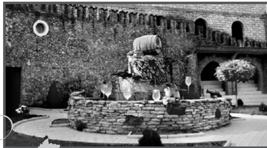
Fontanna z winem

Fontanny były dwie, jedna z winem czerwonym, druga z winem białym. Na samej górze każdej z nich była wielka, piękna beczka, z której „wino” (farbowana