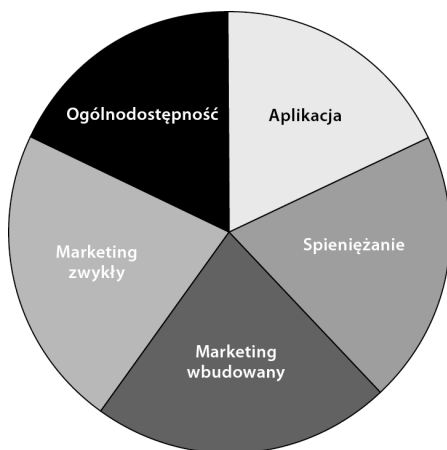
Rysunek 6.2. Ciastko sukcesu aplikacji

Pięć kluczowych aspektów to: aplikacja , ogólnodostępność , spieniężanie , marketing wbudowany , marketing zwykły . Na rysunku 6.2 przedstawiam ciastko sukcesu aplikacji .